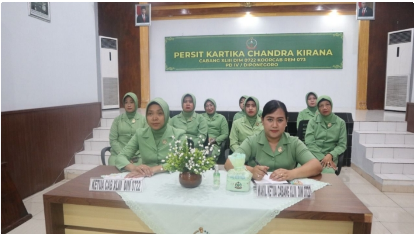
Persit Cab XLIII Dim Kudus Ikuti Webinar Tentang Hukum KDRT, LGBT Dan Perselingkuhan